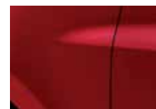
ČERVENÁ DYNA (NNJ)*