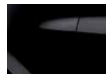
ČIERNA NACRÉ (676)*