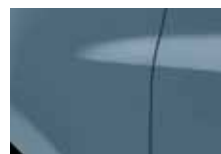
MODRÁ GRIS (J47)*