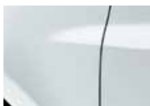
BIELA GLACIER (369)