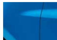
MODRÁ EXTRÉME (RNA)*