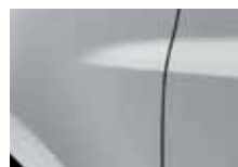
SIVÁ PLATINE (D69)*