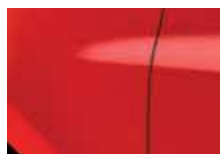
ČERVENÁ VIF (727)