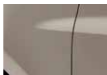
BÉŽOVÁ CENDRÉ (HNK)*